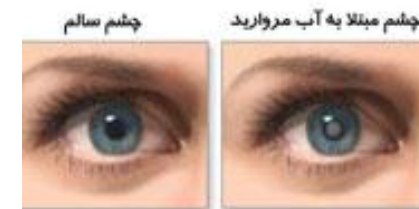
آب مروارید عبارت است از کدر شدن عدسی چشم

اگر کدورت در مرکز لنز ایجاد شود، کاهش دید در مقابل نور بیشتر خواهد بود و یا بیمار ممکن است نزدیک بین شود.